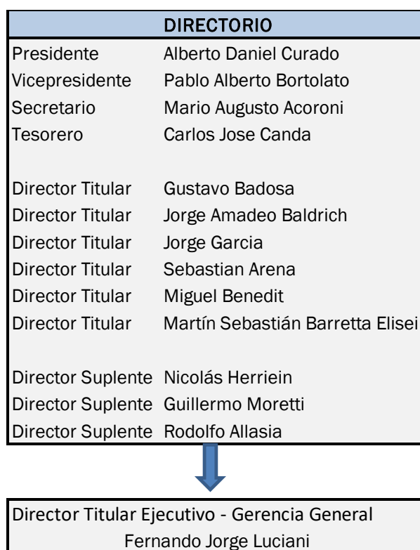
Tabla 1 - Composición del Directorio