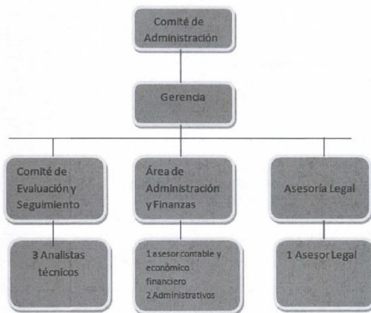
Gráfico 1. Estructura orgánica del Fideicomiso Fondo Fiduciario Fuerza Solidaria

Detallamos la nómina vigente de los integrantes del Comité de Administración actualmente