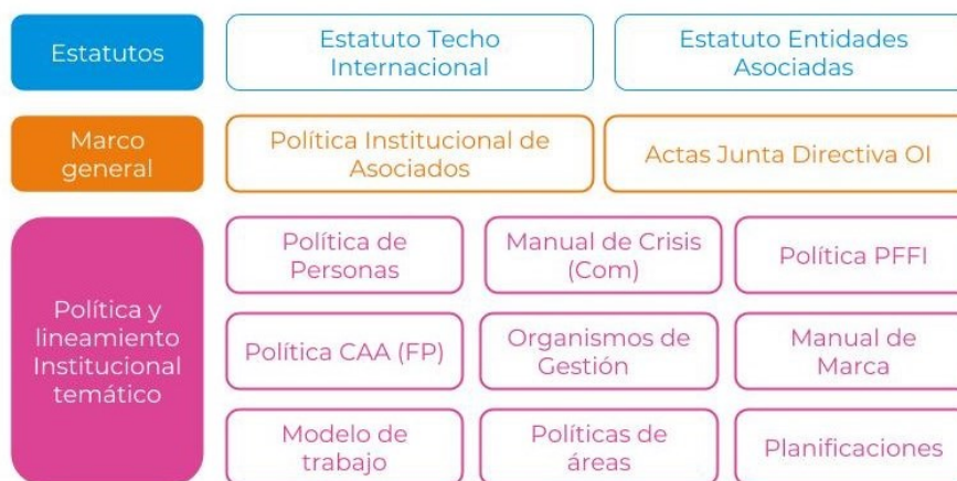
Figura 3 - Estructura organizacional de TECHO Internacional

Para lograr dicho cometido, cuenta con Estatutos tanto de TECHO Internacional como de cada entidad asociada; un marco general donde se determina la política institucional y con las diferentes políticas y lineamientos específicos de cada tema. La siguiente Figura 3 explica cómo se organiza cada oficina (entidad asociada):