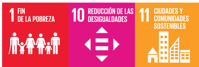
Figura 4 – Objetivos de Desarrollo Sostenible (ODS)

Un aspecto sustantivo del nuevo proyecto, lo constituyen las directrices que en materia de Investigación y Desarrollo, TECHO contemplará para las actividades del emprendimiento. Las mismas se orientan a mejorar los diversos aspectos relacionados con las viviendas dirigidas a sectores populares. En ese sentido se destacan: