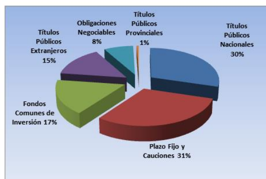
Gráfico 2. Composición de las inversiones del Fondo de Riesgo al 31 de diciembre de 2018.