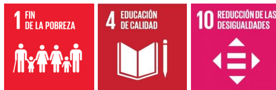
Figura 2 – Impacto buscado en los Objetivos de Desarrollo Sostenible (ODS) con el Proyecto Social de River Plate.

Asimismo, la emisora en los documentos de la emisión describe la estrategia utilizada para la selección de jóvenes talentos que son beneficiarios de la Casa River.