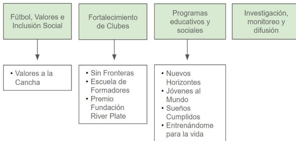
Tabla 2 – Programas realizados por Fundación River Plate del CARP.