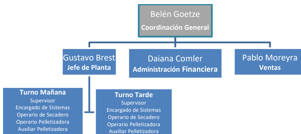
Figura 3 – Estructura organizacional de Zuamar S.A.

La estructura organizacional de Zuamar S.A. es flexible en su conformación, integrada por profesionales y técnicos con la experiencia necesaria para la gestión profesional de la firma. La Figura 3 presenta el organigrama de la empresa.