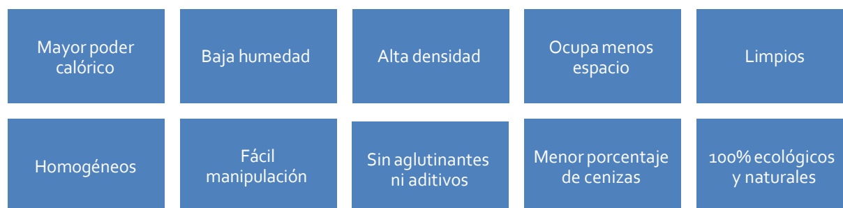
Figura 2 – Ventajas del uso de pellets de aserrín de madera

II. El área de servicios de la empresa, brinda asesoramiento para lograr una mejora en la eficiencia energética, de los usuarios industriales que requieren la generación de energía calórica en sus procesos productivos. Para cumplir con estos servicios, tiene un área de Diseño, donde se diseña e implementa el plan para adaptar las calderas industriales al uso de pellets de madera. Cuenta con un área de Asesoramiento, que realiza el seguimiento y asesoramiento propiamente dicho, una vez adaptada la caldera industrial, para que la utilización del pellets como biocombustible sustituto se realice adecuadamente.