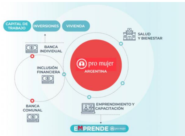
Figura 1 – Actividades realizadas por PMA.

A su vez, en el Prospecto de emisión, se menciona que el impacto positivo buscado por las actividades de PM en los Objetivos de Desarrollo Sostenible (ODS) de la Organización de las Naciones Unidas son los siguientes, para los cuales presenta distintos indicadores para medir su impacto: