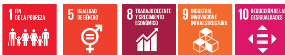
Figura 2 – Impacto buscado en los Objetivos de Desarrollo Sostenible (ODS) en los créditos a otorgar.