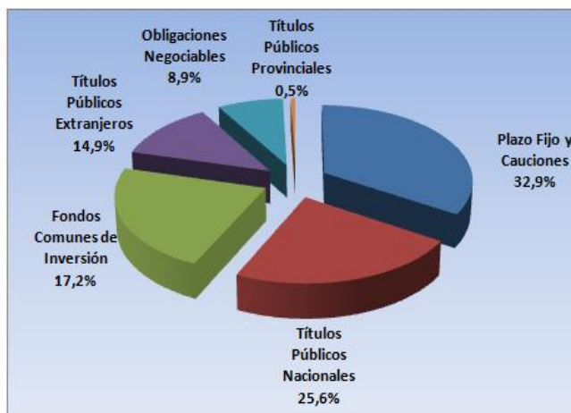
Gráfico 1. Composición de las inversiones del FR al 31 de marzo de 2020.