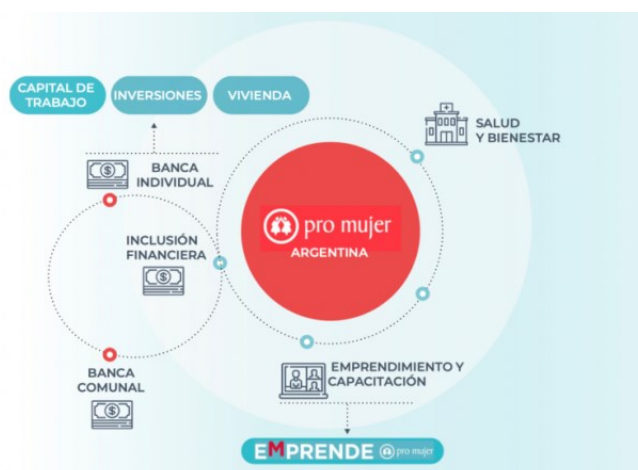
Figura 1 – Actividades realizadas por PMA

El mercado objetivo de PMSF son mujeres mayores de edad, de escasos recursos económicos, con reducido o nulo acceso al sistema financiero formal, con necesidades financieras y de desarrollo personal, preferiblemente alfabetizadas y que estén desarrollando una actividad económica o emprendimiento generador de ingresos para su familia.