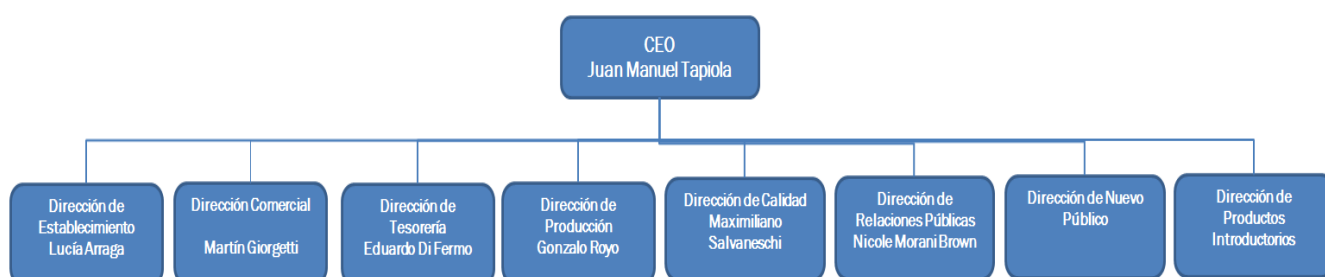
Figura 1. Organigrama.

Actualmente la compañía cuenta con más de 180 colaboradores. Un equipo de trabajo interdisciplinario con una variada formación (integran el equipo de profesionales ingenieros/as, arquitectos, especialistas en marketing, comunicación, recursos humanos, psicólogos/as, finanzas y administración, entre otros) y experiencia profesional en empresas de primera línea a nivel nacional que se encuentran organizados como muestra la Figura 1.