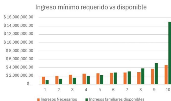
Gráfico 1 Ingresos Disponibles vs. Necesarios. Por decil