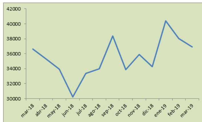
Evolución de la cuotaparte En pesos por cada mil cuotapartes

A partir de septiembre de 2018, el mercado accionario ingresó en una fase de fuerte volatilidad, con importantes cambios en los valores accionarios, y con tendencia incierta. El mercado recibió de manera directa, la incertidumbre en el mercado cambiario y financiero. Los sucesos financieros a partir de octubre de 2018, transmitieron sus efectos hacia el mercado accionario impactando negativamente en la trayectoria de las cotizaciones y en la evolución de la volatilidad. Estas características han sido replicadas por el Fondo. Las circunstancias señaladas, se reflejaron en moderados o nulos rendimientos. El YTD (rendimiento anual) a marzo de 2019 alcanzó al +7,6%. En los últimos 180 días la variación fue de -3,8%. La evolución de la cuotaparte es casi similar a la del Índice S&P Merval.